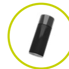
Bomboletta MICACEO per ritocchi